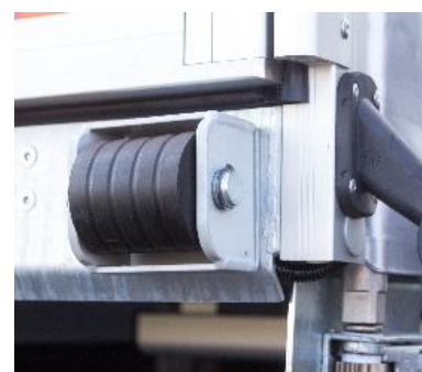
Odbojniki rolkowe na tylnym obrzeżu