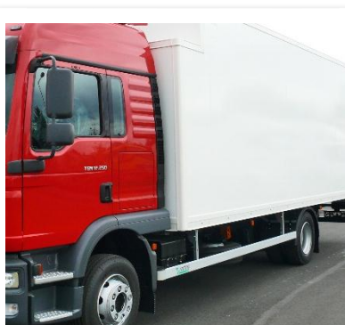
Uchylnie osłony przeciwnajazdowe (aluminiowe)