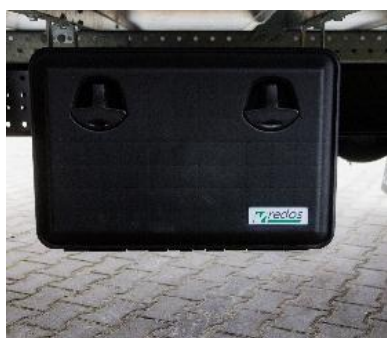
Skrzynka narzędziowa z tworzywa zamykana na klucz, 600x415x460 mm