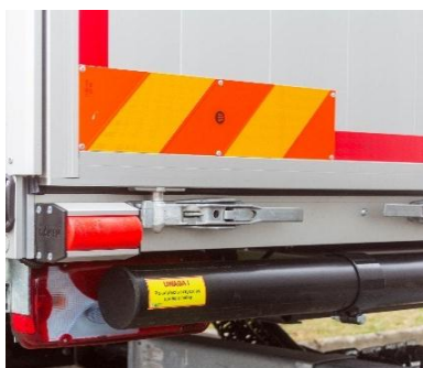
Tablice odblaskowe tylne