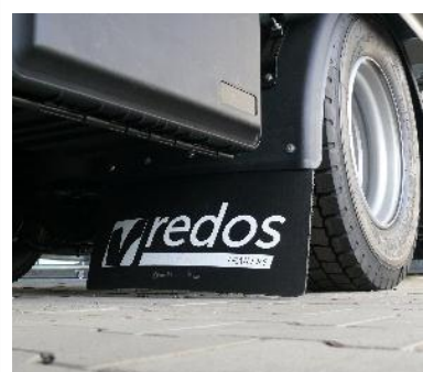
Blotniki z fartuchami antyrozbrzygowymi